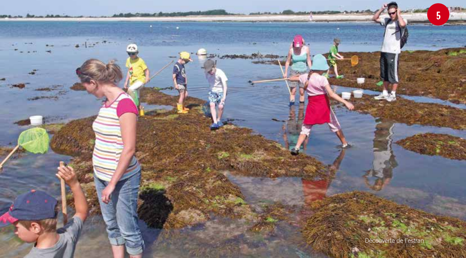
Découverte de l'estran