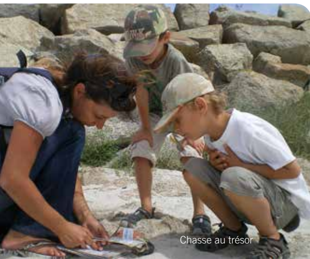
Chasse au trésor