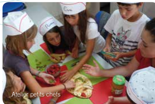
Atelier petits chefs

Tarif : 4,60 € - Durée : 2h Par groupe de 6 avec un accompagnateur.