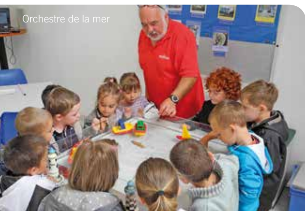
Orchestre de la mer