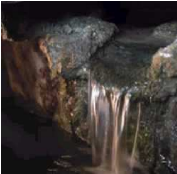
Source de la Grotte de Lourdes

pain de la Parole de Dieu et devenir ses témoins en risquant une parole libre, habitée et sans calcul...