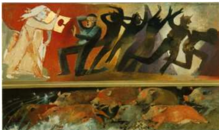
ARCABAS, Le possédé de gerasa, St Hugues de Chartreuse