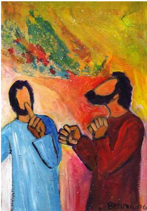
Peinture provenant du site http://www.evangelie-et-peinture.org/

20 Alors cet homme s'en alla, il se mit à proclamer dans la région de la Décapole tout ce que Jésus avait fait pour lui, et tout le monde était dans l'admiration.