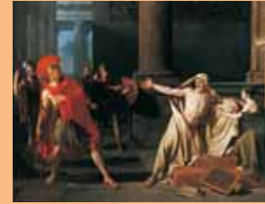
Michel-Martin Drolling (1786-1851) La Mort de Démosthène , 1806

Ce domaine englobe les tableaux représentant des scènes contenant des éléments d'architecture, d'urbanisme et de paysage.