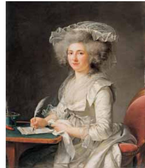
Adélaïde Labille-Guiard (1749-1803), Portrait de femme , vers 1787. Huile sur toile, 100 x 81 cm.