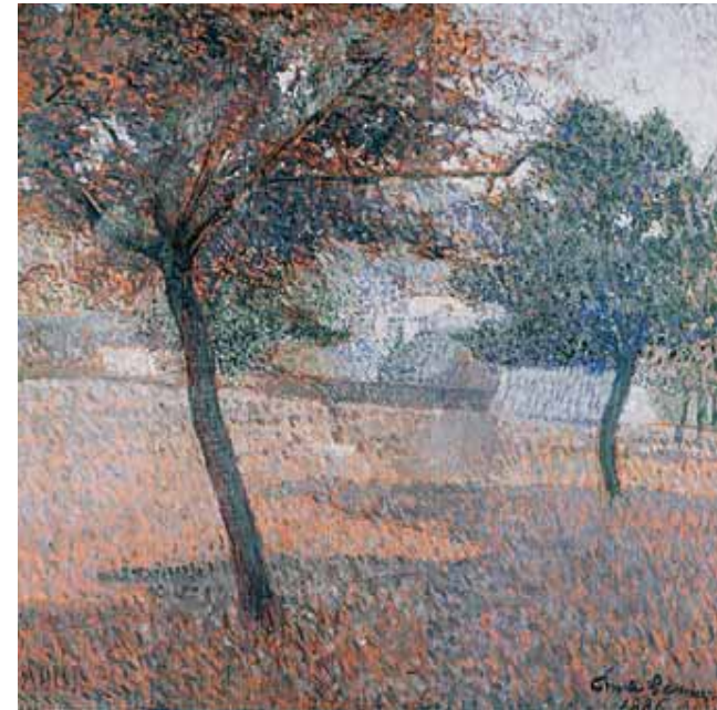
Émile Bernard (1868-1941), Août, verger à Pont-Aven , 1886. Huile sur bois, 52 x 52 cm.

L'œuvre d'art fait appel à des techniques très différentes, et apparaît elle-même souvent comme un aboutissement, une prouesse technique. Le musée est un terrain d'exploration de ces différentes formes d'art.