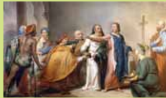
Georges Rouget (1783-1869) Saint Louis prisonnier en Egypte , 1817-1818