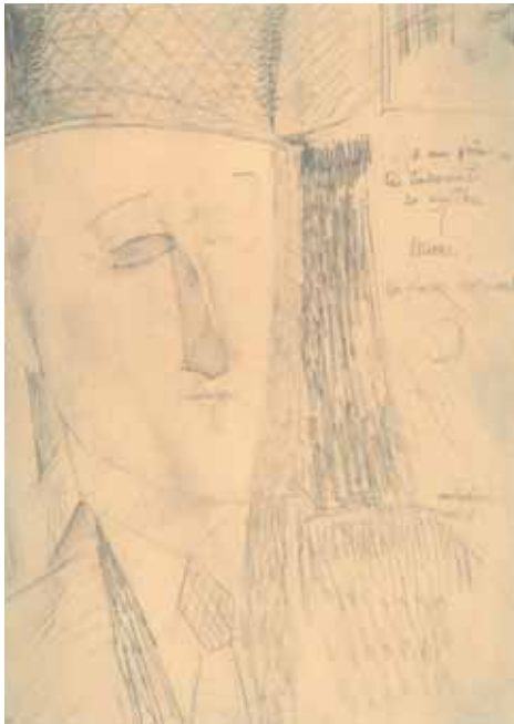
Amadeo Modigliani (1884-1920), Portrait de Max Jacob , 1915-1916. Crayon graphite sur papier, 34,5 x 26,5 cm.

Cette thématique permet d'aborder les grands mouvements artistiques comme autant d'innovations, mais aussi de tisser des liens entre des époques et des lieux distincts, pour cheminer entre tradition, modernité et avant-gardes.