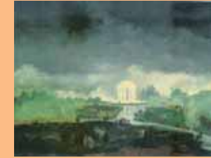
Hubert Robert (1733-1808) Fête de nuit à Trianon , vers 1782-1783