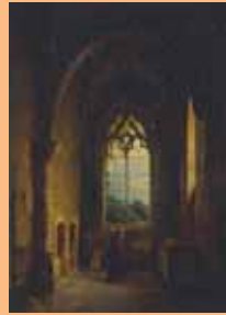
Louis-Jacques Mandé Daguerre (1787-1851) Moine dans une chapelle , vers 1820-1840