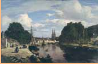
Eugène Boudin (1824-1898) Vue du port de Quimper, 1857