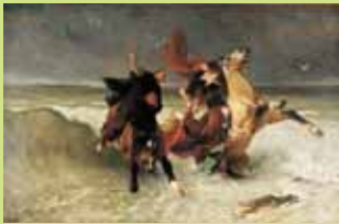
Evariste-Vital Luminais (1822-1896) La Fuite du Roi Gradlon, vers 1884