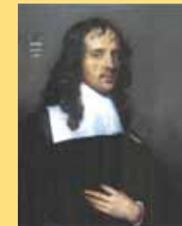
Adriaen Hanneman (1604-1671)