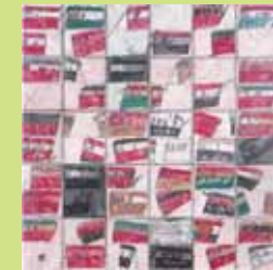
François Dilasser (né en 1926) La Mer rouge III ou Passage de la mer rouge, 1990