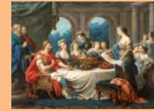
Louis-Jean-François Lagrenée (1725-1806) Esther et Assuérus , vers 1775-1780