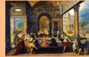
Louis de Caullery (vers 1580-vers 1621) La Parole de l'enfant prodigue , début xvii e siècle