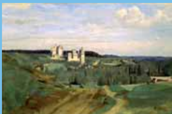
Jean-Baptiste Camille Corot (1796-1875) Vue du château de Pierrefonds, vers 1840-1845