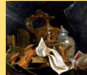
Nicolas de Largillière (1656-1746) Nature morte avec instrument de musique , vers 1695-1700