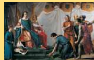
Georges Rouget (1783-1869) Saint Louis pardonnant à Pierre de Bretagne , 1817