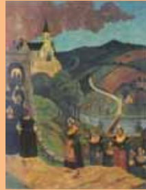
Paul Sérusier (1864-1927) Le Pardon de Notre-Dame-des-Portes à Châteauneuf-du-Faou, 1894