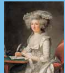
Adélaïde Labille-Guiard (1749-1803) Portrait de femme , vers 1787