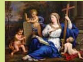
Pierre Mignard (1612-1695) La Foi , 1692