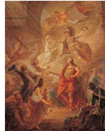
Nicolas-Guy Brenet (1728-1792), Louis XVI jurant fidélité à la Constitution sur l'autel de la patrie , 1790. Huile sur toile, 61 x 46,5 cm.

Brenet, Louis XVI jurant fidélité à la Constitution sur l'autel de la patrie , Paradis, Les Enrôlements volontaires , Melingue, Le Départ de la Tour d'Auvergne