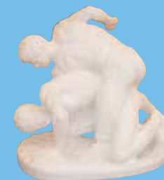
Anonyme Les Luteurs , copie XIX e siècle d'antique

Ce domaine s'applique à illustrer une époque par une œuvre emblématique de la collection.