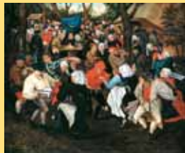
Pieter II Brueghel (1564-1638) La Danse de noces , vers 1600