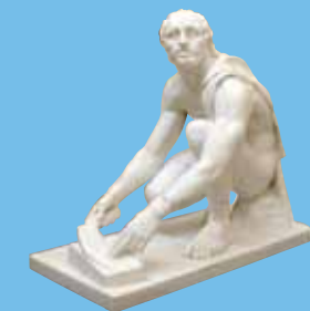
Anonyme L'esclave scythe aiguisant un couteau , copie XIX e siècle d'antique