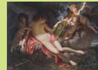
Charles Meynier (1768-1832) L'Amour adolescent pleurant sur le portrait de Psyché qu'il a perdue , 1792