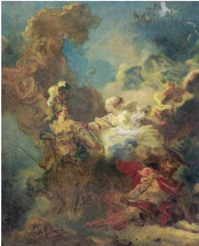
Jean-Honoré Fragonard (1732-1806), Le Combat de Minerve contre Mars , vers 1771. Huile sur toile, 46 x 38 cm

Dell'Abate, Le Sommeil de Vénus , Boucher, L'Enlèvement de Proserpine , Fragonard, Le Combat de Minerve contre Mars