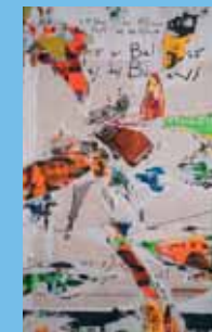
Jacques Villeglé (né en 1926) Rue Chaptal, 18 août 2006